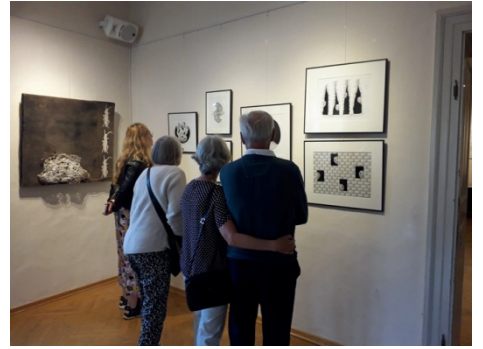
Eröffnung am 13. Juni 24