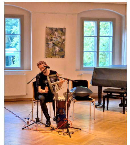
Musik: Bernhard Weiss